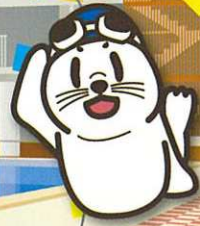
日本マスターズ水泳協会 マスコットキャラクター JAMBOW (ジャンボウ)