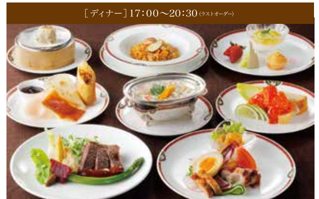
[ディナー] 17:00~20:30 (ラストオーダー)