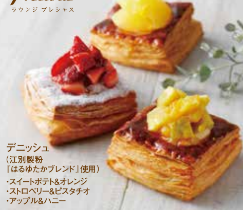
デニッシュ (江別製粉 「はるゆたかブレンド」使用) ・スイートポテト&オレンジ ・ストロベリー&ピスタチオ ・アップル&ハニー