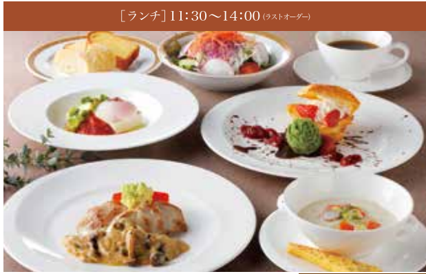
[ランチ] 11:30~14:00 (ラストオーダー)