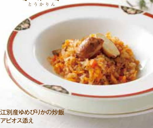
江別産ゆめびりかの炒飯 アピオス添え