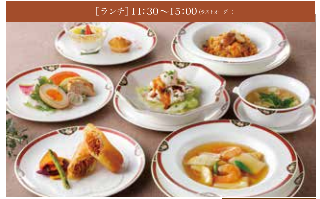
[ランチ] 11:30~15:00 (ラストオーダー)