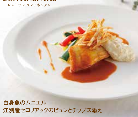
白身魚のムニエル 江別産セロリアックのピュレとチップス添え